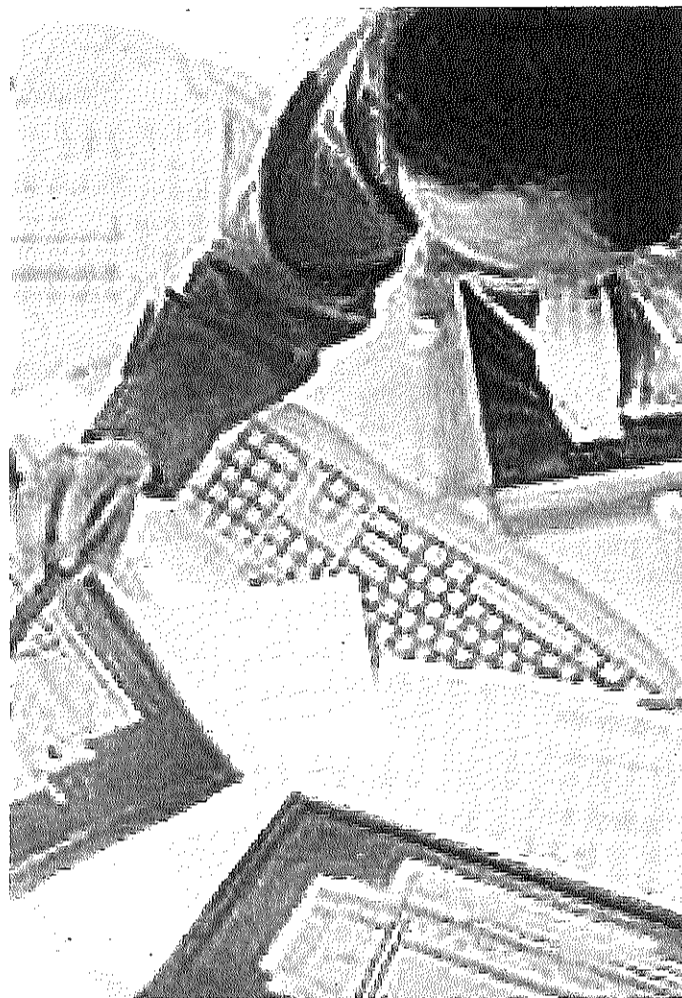
Supporto per andare online La Cna si impegna per i propri associati

cesse esclusivamente sotto forma di contributi a fondo perduto e nella misura massima dell'80% del progetto di spesa ammissibile e, comunque,