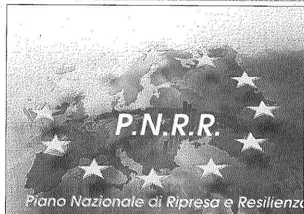
Sfida Pnrr Cna con idee chiare per non perdere le opportunità

capitali privati. Adattare il Pnrr al nuovo contesto apre spazi ad esempio alla nostra proposta di favorire investimenti in piccoli impianti per l'autoproduzione di energia da fonti rinnovabili sfruttando i capannoni delle micro e piccole imprese (credito d'imposta massimo 50% dei costi).